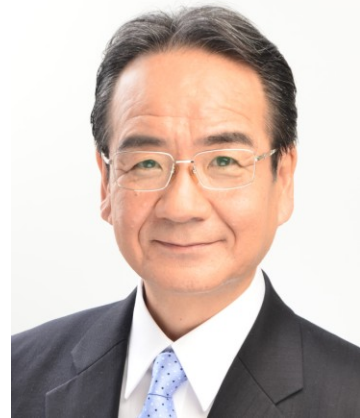
市議会議員・一級建築士